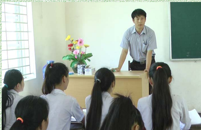
Giờ học chống bạo lực gia đình

đình và biện pháp phòng ngừa, can thiệp, xử lý kịp thời các trường hợp liên quan đến bạo lực gia đình.